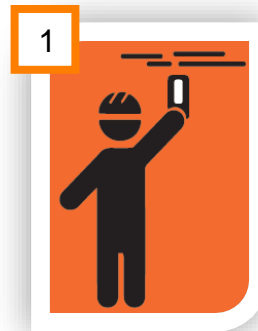
LIMPIA LA SUPERFICIE

Utilizar equipo básico de seguridad como gafas o anteojos, guantes y camisa de algodón de manga larga para evitar el contacto con la piel.