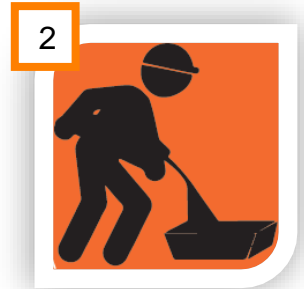
VACIA EL PRODUCTO